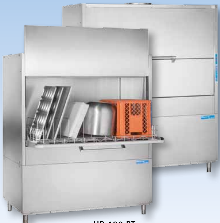
HD 130 BT