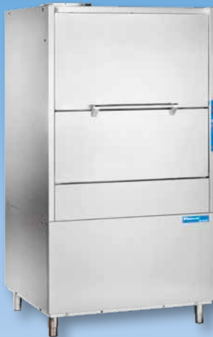
HD 80 BT