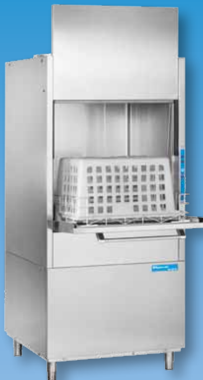
HD 60 BT