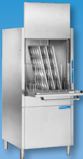
HD 40 BT