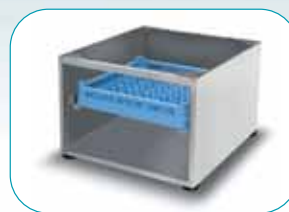
Base con tres lados cerrados