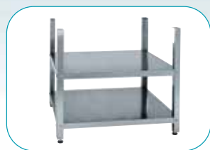
Base abierta 43/48/53/60

La dureza del agua de conexión TIENE que ser entre 4° - 10° F (dureza francesa). Si hay durerzas superiores, tiene que utilizar un decalcificador.